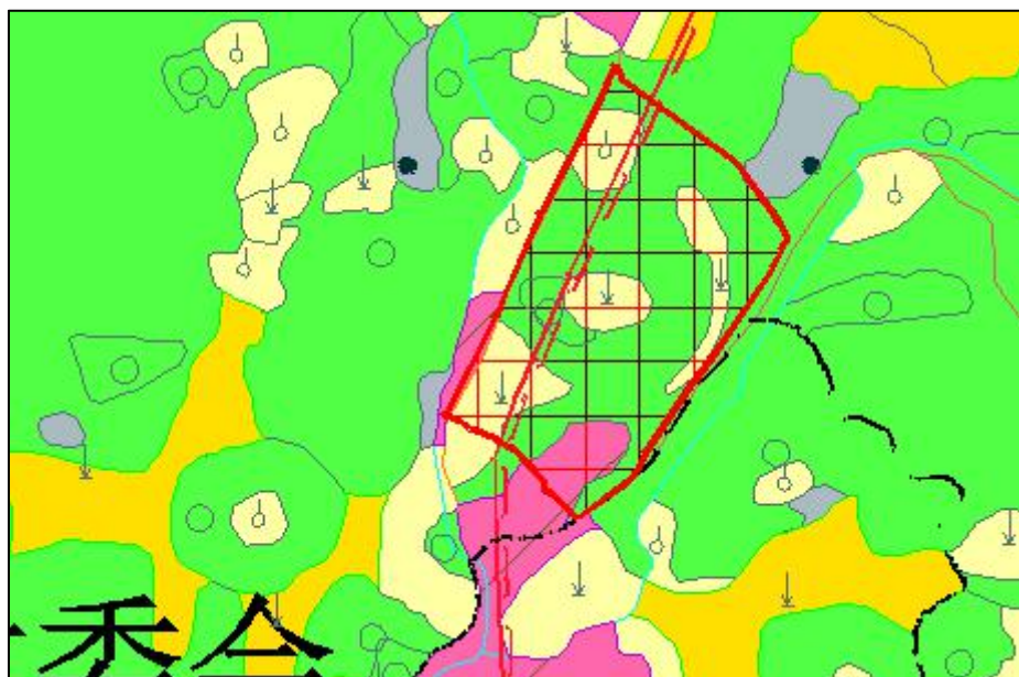
图 2 断龙山镇农村居民点用地调入区域

本次规划修改，由于村级公共设施建设、农民建房需求，调入农村居民点用地 4.35 公顷，主要分布在田家洞村、溪龙车村等村。