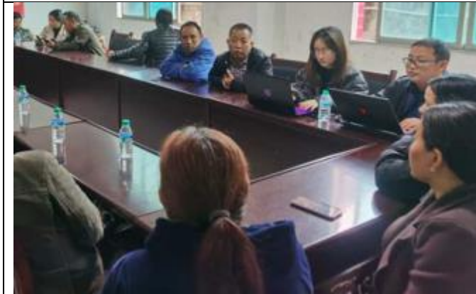
龙山县苗儿滩镇隆头社区座谈会