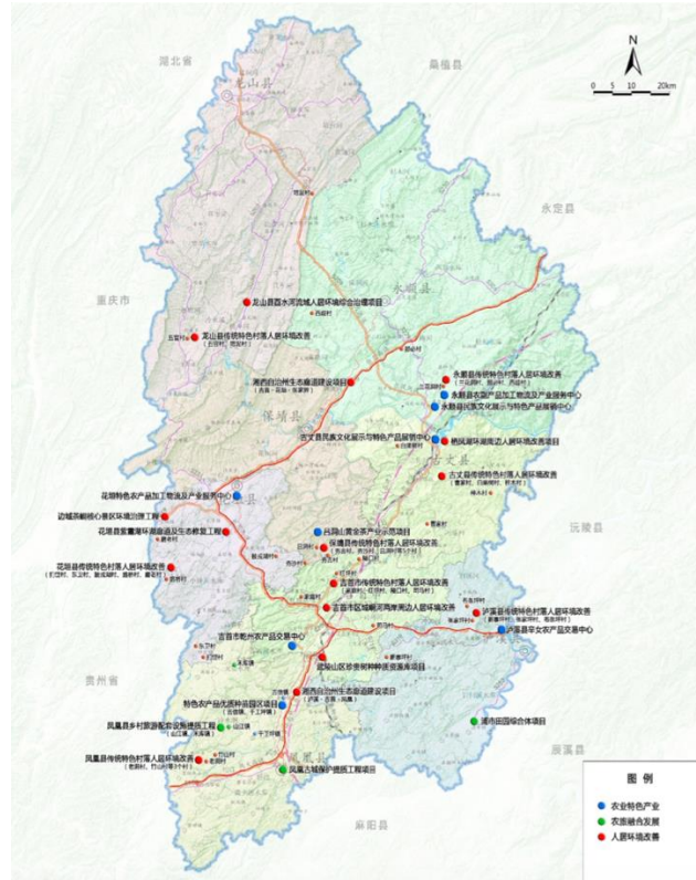
图 2：项目组成与分布情况

项目实施支持： 项目实施支持部分旨在通过管理人员的能力建设，执行机构跨部门合作良好，利益攸关方充分参与，项目监测和评估工作良好，强化的技术服务等，从而确保本项目的成功实施。