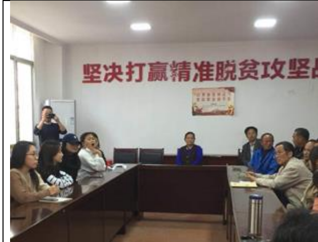
泸溪县浦市镇岩门溪村座谈会