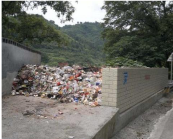
图 4: 垃圾堆满为患的乡村垃圾收集点（古丈县古丈镇且茶村）