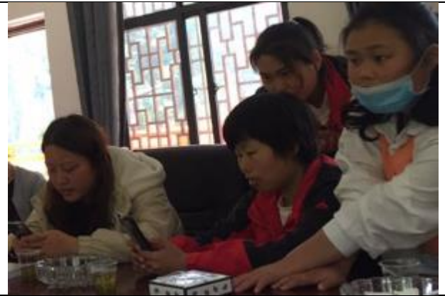
永顺县灵溪镇司城村关键信息者访谈