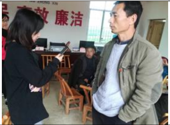
花垣县麻栗场镇新科村关键信息者访谈