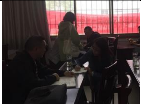
保靖县迁陵镇府库村关键信息者访谈