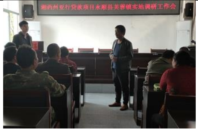
永顺县芙蓉镇新城社区讨论会