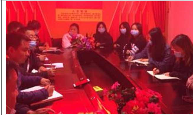
永顺县灵溪镇南山社区座谈会