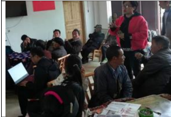
花垣县麻栗场镇新科村座谈会