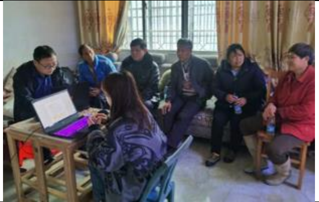
龙山县里耶镇杨家寨村讨论会