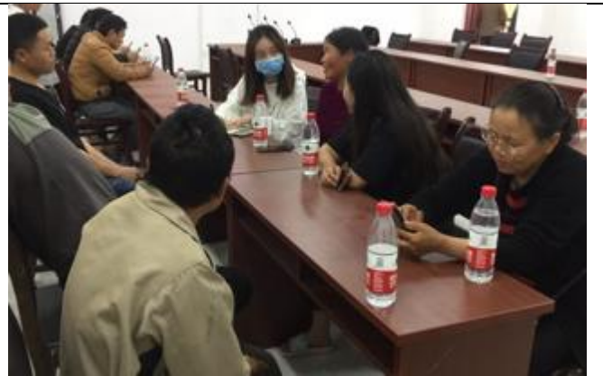
保靖县吕洞山镇夯吉村讨论会