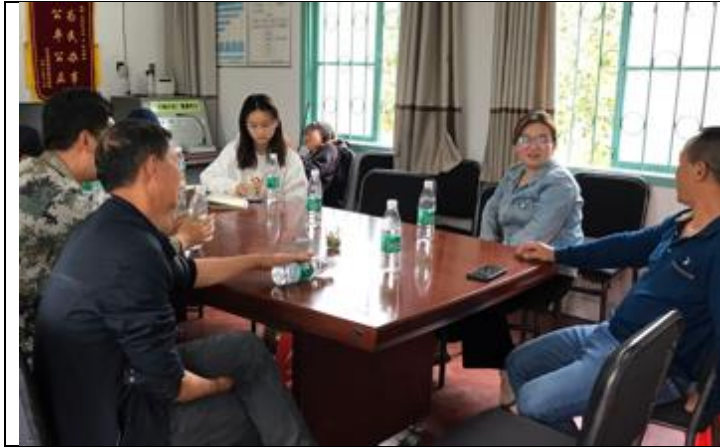
古丈县古阳镇且茶村座谈会