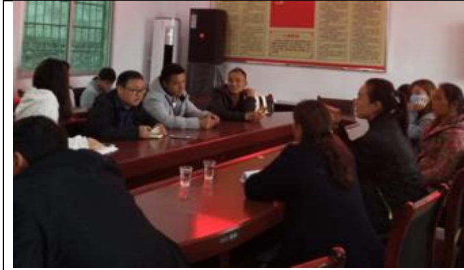
花垣县花垣镇辽洞村座谈会