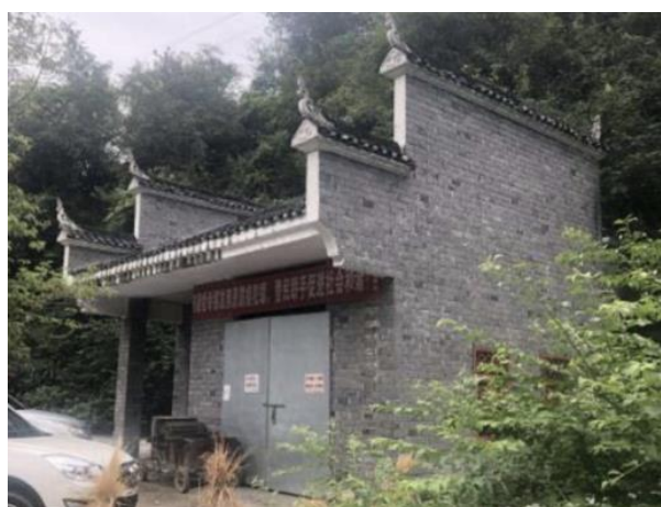
图 3：少数民族村庄已建成尚未运行的垃圾转运站（花垣县花垣镇紫霞村）

(2)改善农村生活垃圾收集服务：农村生活垃圾问题是少数民族和非少数民族农村地区共同关注讨论和需要解决的主要环境问题。尽管近年来项目区部分乡镇已建立了垃圾中转站和焚烧炉；但是由于经费和管理的问题，大部分垃圾中转站尚未启用。农户的垃圾仍然由农户自行处理，垃圾仍然随意丢弃在田间、河道，垃圾围村、垃圾污水现象较为严重，垃圾收集点也存在垃圾堆满为患的满溢问题。少数民族群众代表希望提升现有垃圾处理的能力，新建垃圾收集处理中心，并增加相应的垃圾收集转运车辆等基础设施和工作人员，以及时回收垃圾，还少数民族一方净土。详见图 3 和图 4 以及表 16。