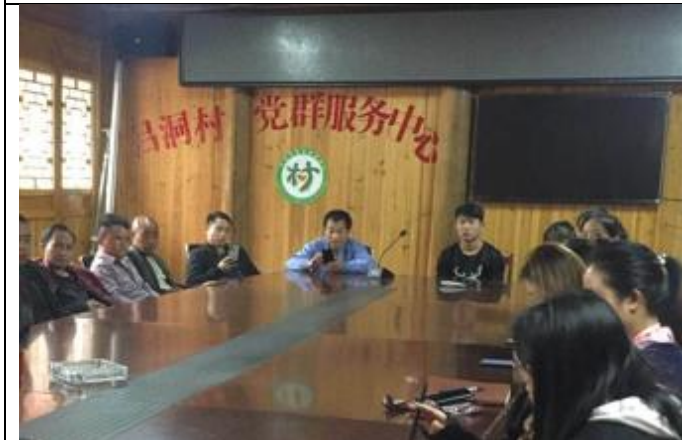
保靖县吕洞山镇吕洞村座谈会