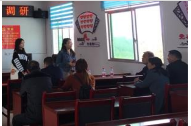
泸溪县浦市镇浦溪村座谈会