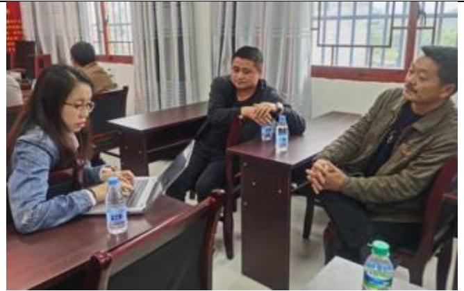
龙山县苗儿滩镇苗市社区关键信息者访谈