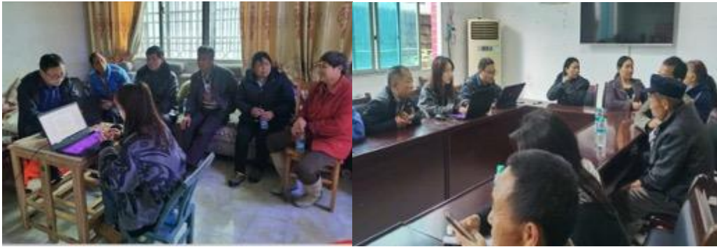
图 6：少数民族焦点小组座谈会