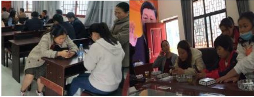
图 5：少数民族区域妇女问卷调查