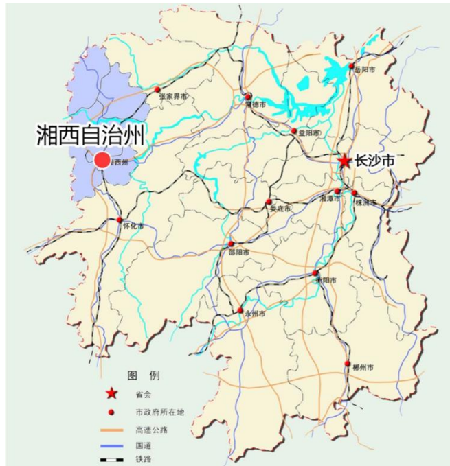
图 1：中国湖南省湘西州的地理位置